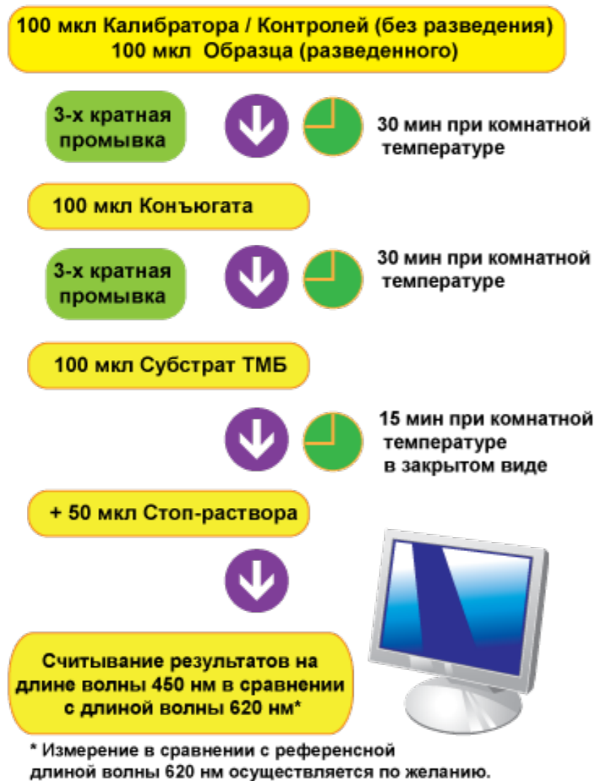
СХЕМА ПРОВЕДЕНИЯ АНАЛИЗА: AI-LINE ELISA